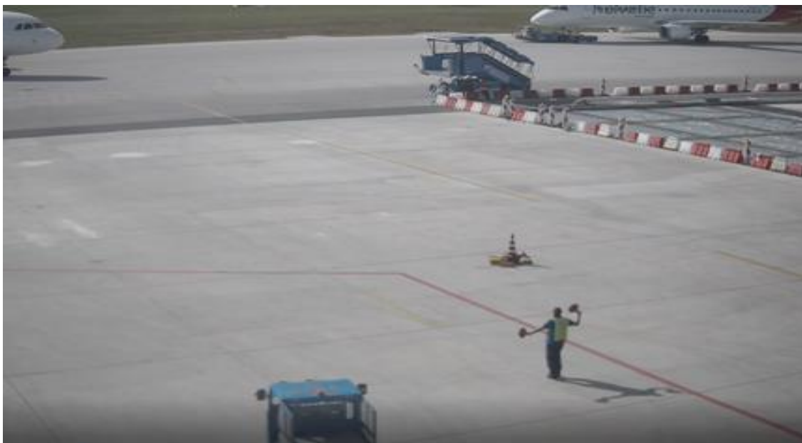
Slika broj 1.2. Pozicija početka skretanja avion prema poziciji br.5 i sigaliste na izmještenoj poziciji

Po izlasku iz vozila „Follow me“, na izmještenoj poziciji , parker signalista se postavio na liniju vodilju izmještene pozicije, podigao palice kako bi ga posada uočila. Odmah nakon uočavanja da ga avion ne prati i da se ne kreće prema izmještenoj poziciji, davao je znake posadi aviona da izvrši skretanje (korekciju) prema izmještenoj liniji vodilji za parkiranje. (Slika broj 1.3.)