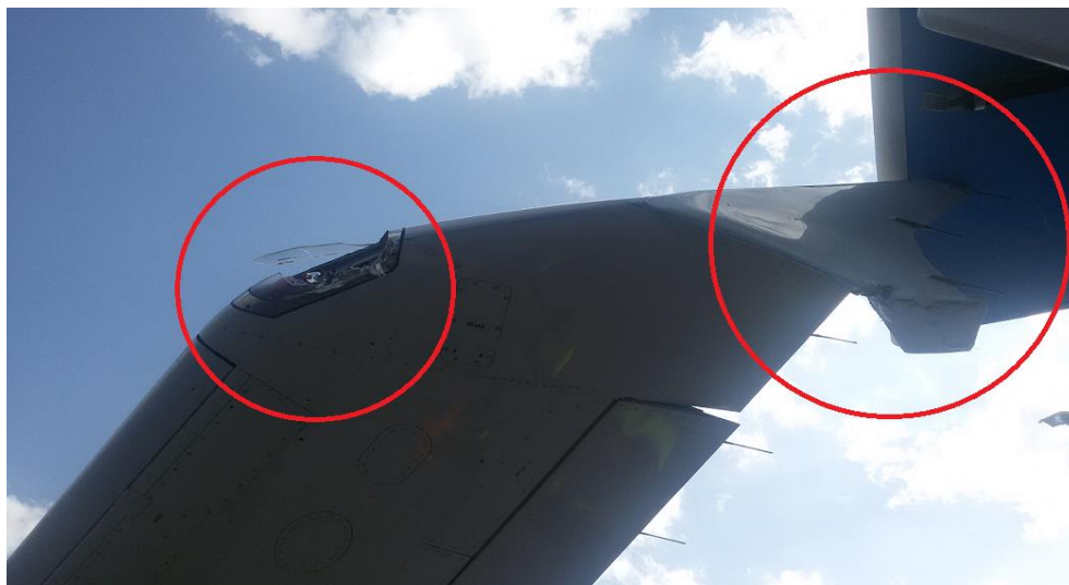
Slika broj 1.7. Oštećenja kraja lijevog krila i pozicionog svijetla