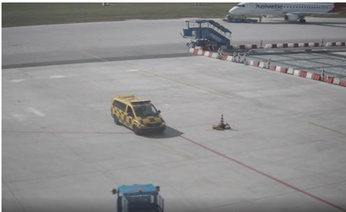
Slika broj 1.1 Dolazak vozila "Follow Me" na izmještenu parking poziciju

Vozač, odnosno parker signalista, sa vozilom „Follow me“, sa TWY "ALFA" bočno, u visine privremeno izmještene parking pozicije broj 5. skrenuo je u desno i sa povećanom brzinom vozila kretao se u pravcu privremeno označene izmještene poziciji za parkiranje broj 5. (Slika broj 1.1.)