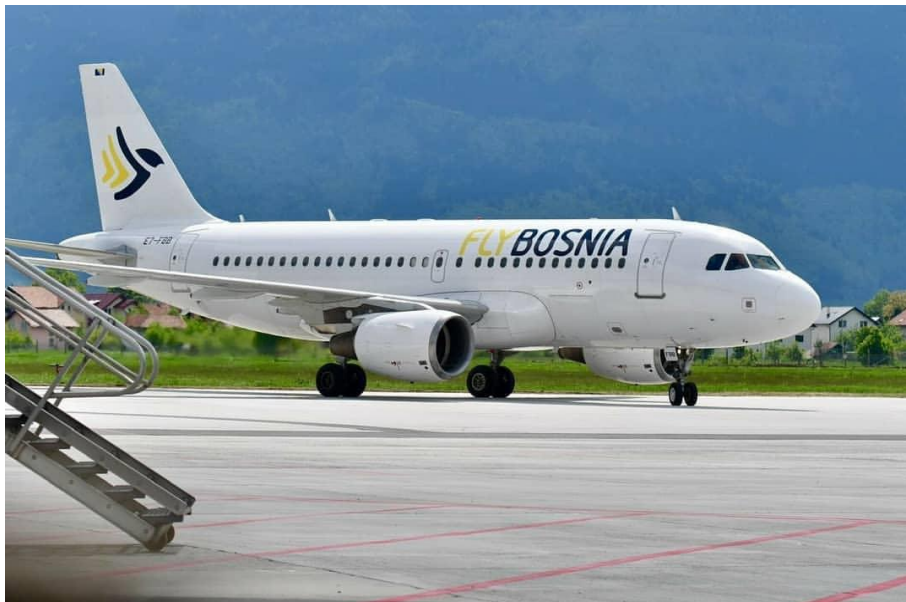
Slika broj 1.8. Avion A319