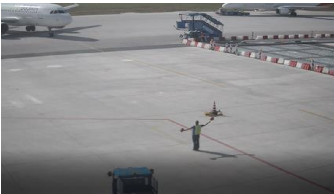
Slika broj 1.3. Položaj parkera signaliste i aviona tokom skretanja prema poziciji br.5

Po izlasku iz vozila „Follow me“, na izmještenoj poziciji , parker signalista se postavio na liniju vodilju izmještene pozicije, podigao palice kako bi ga posada uočila. Odmah nakon uočavanja da ga avion ne prati i da se ne kreće prema izmještenoj poziciji, davao je znake posadi aviona da izvrši skretanje (korekciju) prema izmještenoj liniji vodilji za parkiranje. (Slika broj 1.3.)