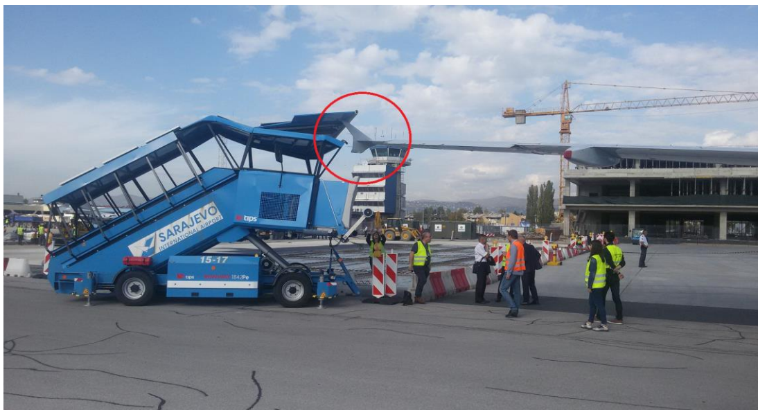
Slika broj 1.5. Udar lijevog krila u stepenice