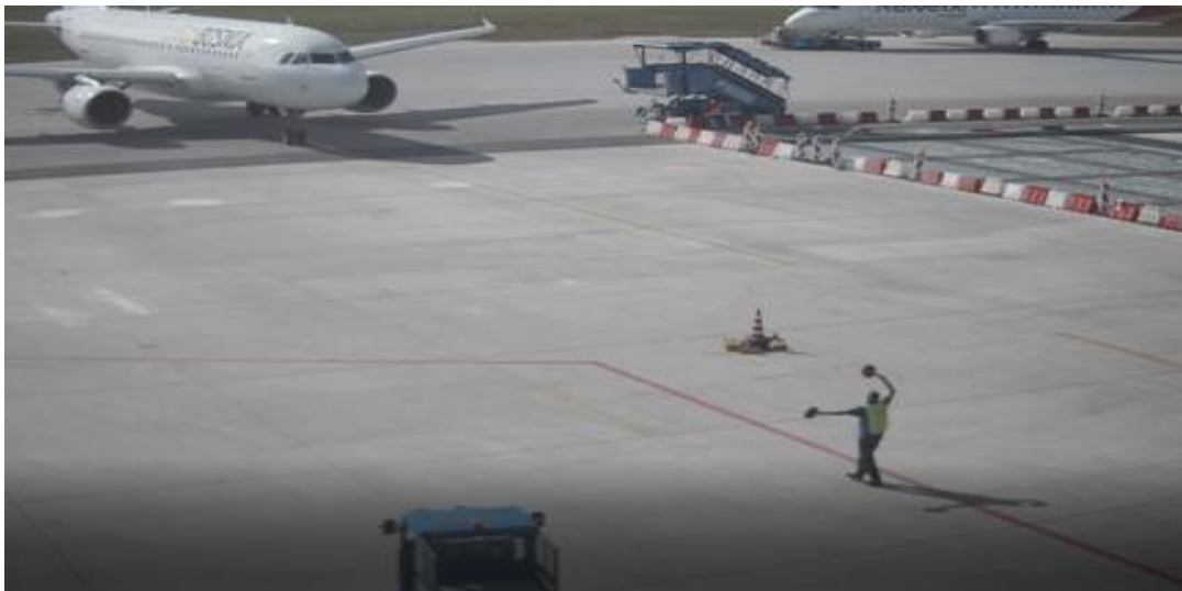
Slika broj 1.4. Položaj aviona i parkera signaliste u prilaženju prema poziciji br.5

Posada nije odmah uočila poziciju parkera signaliste, u putanji žute linije na izmještenoj poziciji broj 5. Sa manjim zakašnjenjem, posada je uočila da se parker signalista nalazi desno od žute linije za poziciju za parkiranje broj 5. na udaljenosti od 10m, koji je davao oznake posadi da treba skrenuti više desno i da napustiti žutu liniju za poziciju za parkiranje broj 5. (Slika broj 1.4.)