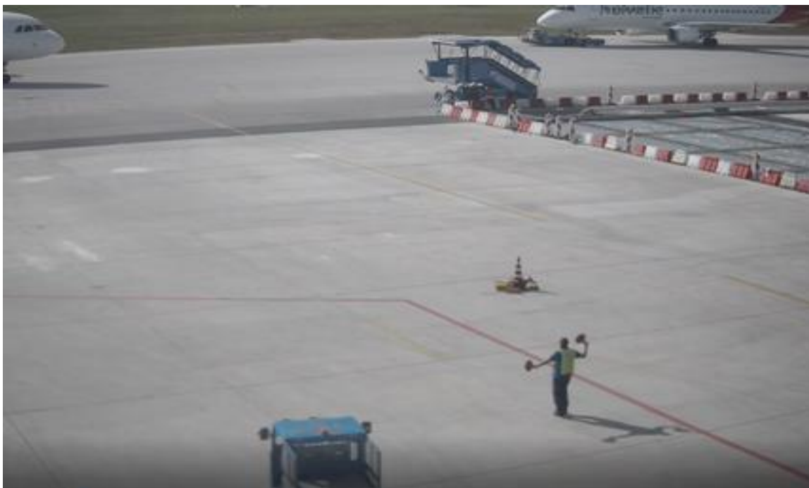
Slika broj 1.9. Mjesto ozbiljnog incidenta

Južno od označenog gradilišta na TWY "ALFA " bio je izguran avio Swiss Air, nosom okrenut prema A319, koji je sklonjen sa pozicije broj 4 kako bi se obezbjedilo sigurno mjesto za parkiranje aviona FLYBOSNIE na izmješteno mjesto broj 5.(Slika broj 1.9.)